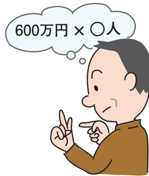
表1 相続税の基礎控除額