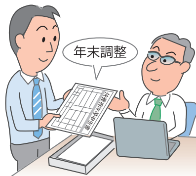
図 年末調整の流れ

具体的には、生命保険料控除欄の「保険金等の受取人」欄のうちの「あなたとの続柄」欄、地震保険料控除欄のうちの「保険等の対象となった家屋等に居住又は家財を利用している者等の氏名」に係る「あなたとの