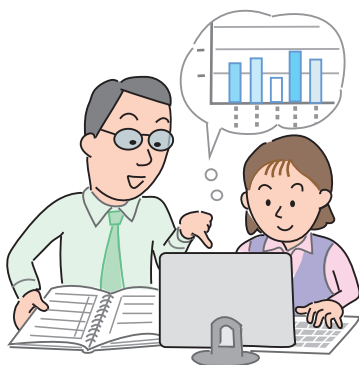
図1 繰越税額控除制度のイメージ

この規定の適用を受ける場合には、賃上げ促進税制の適用を受けた事業年度以後の各事業年度の確定申告書等に、明細書を添付する必要があります。